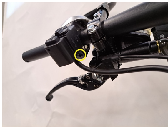
Löysää vasemman kahvarungon kiristys ruuvi (kuusiokoloavain 3 mm).