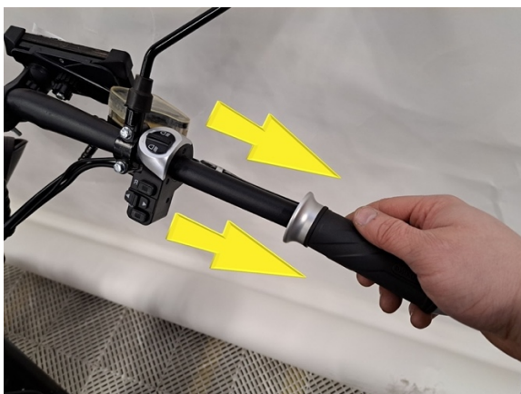
Vedä vasen kahvatuppi irti. Käytä tarvittaessa jarrukliineriä liukasteena.