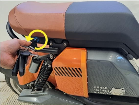
Avaa penkin lukitus avaimella.

Oire: Vasemman puolen katkasija ei toimi tai osa niistä ei toimi.