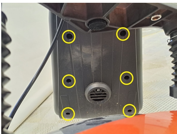
Irrota kuvassa näkyvät ruuvit. (Ristipäämeisseli ph2).