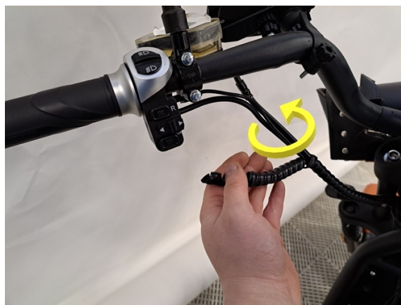
Pyörittele johdonsuojaspiraali pois johtojen ympäriltä.