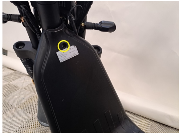
Irrota kuvassa näkyvä pultti. (kuusiokoloavain 5 mm).