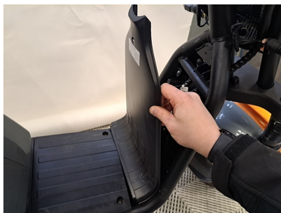
Ota rungon etuosan takakate pois.